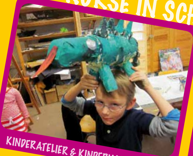
KINDERATELIER & KINDERWERKSTATT