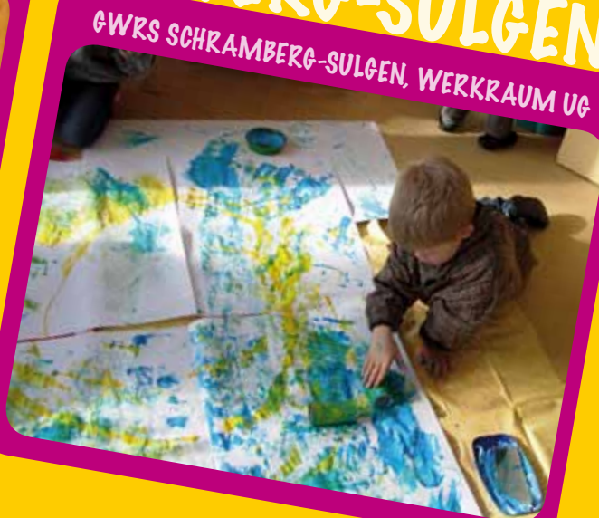
GWRS SCHRAMBERG-SULGEN, WERKRAUM UG